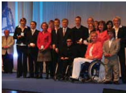
Leichtathletik-Teilnehmer mit Bundespräsident Horst Köhler

Auch Rosi Mittermaier-Neureuther äußerte sich begeistert über Marianne Buggenhagens Leistungen: "Marianne Buggenhagen ist nicht nur die erfolgreichste Leichtathletin des deutschen Sports insgesamt, sondern auch ein Vorbild für Soziales, Integration und gegenseitige Toleranz förderndes Verhalten. Ihr positiver Einfluss in die Gesellschaft hinein zeigt sich etwa daran, dass sich zwei Körperbehindertenschulen in Deutschland "Marianne-Buggenhagen-Schule" nennen."